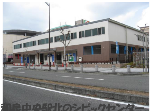
【3】和泉中央駅北のシビックセンター2地区、URとの譲渡契約成立

【金児】通告してから思い切ってその量販店の店長さんにお話をしたところ、駐輪問題でずっと悩んでいるとのことだった。今後トリヴェール和泉の人口が増えれば台数がふえる可能性もあり、今でも通路は通れない上、景観や倫理的な観点からみずれば解決に向けて考える必要がある。