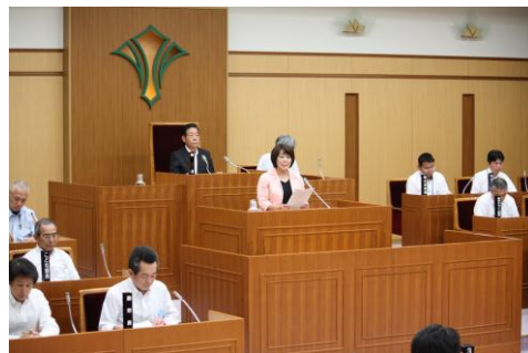
6月議会で一般質問(議場にて)