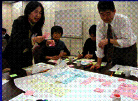
グループに別れて討議する