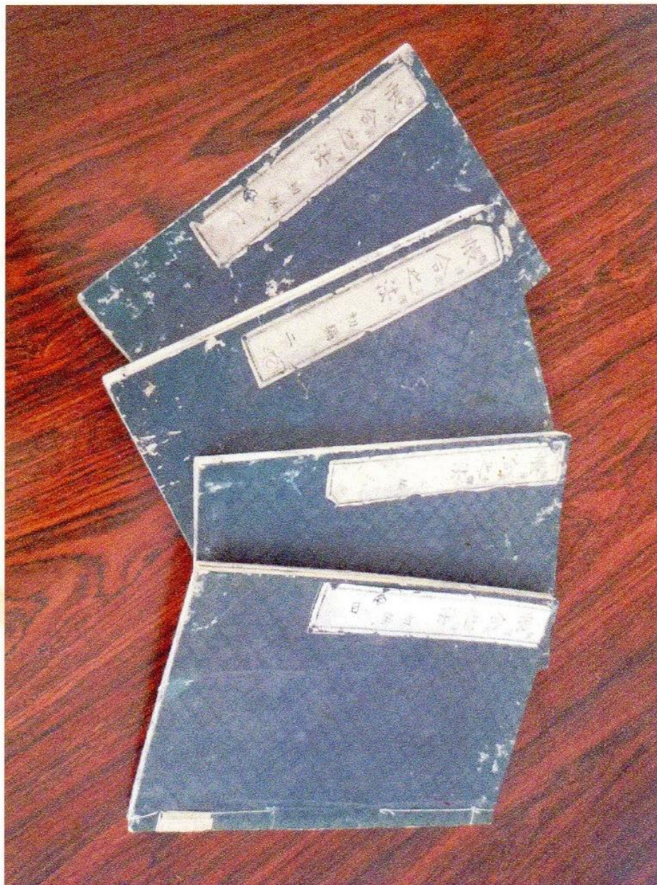
【資料1】『帳合之法』全四卷（愛知県立豊橋商業高等学校所蔵）