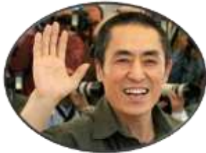
チャン・イーモウ監督