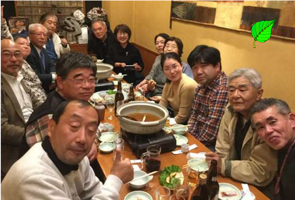
「庄や八重洲口店」で出来上がりの面々