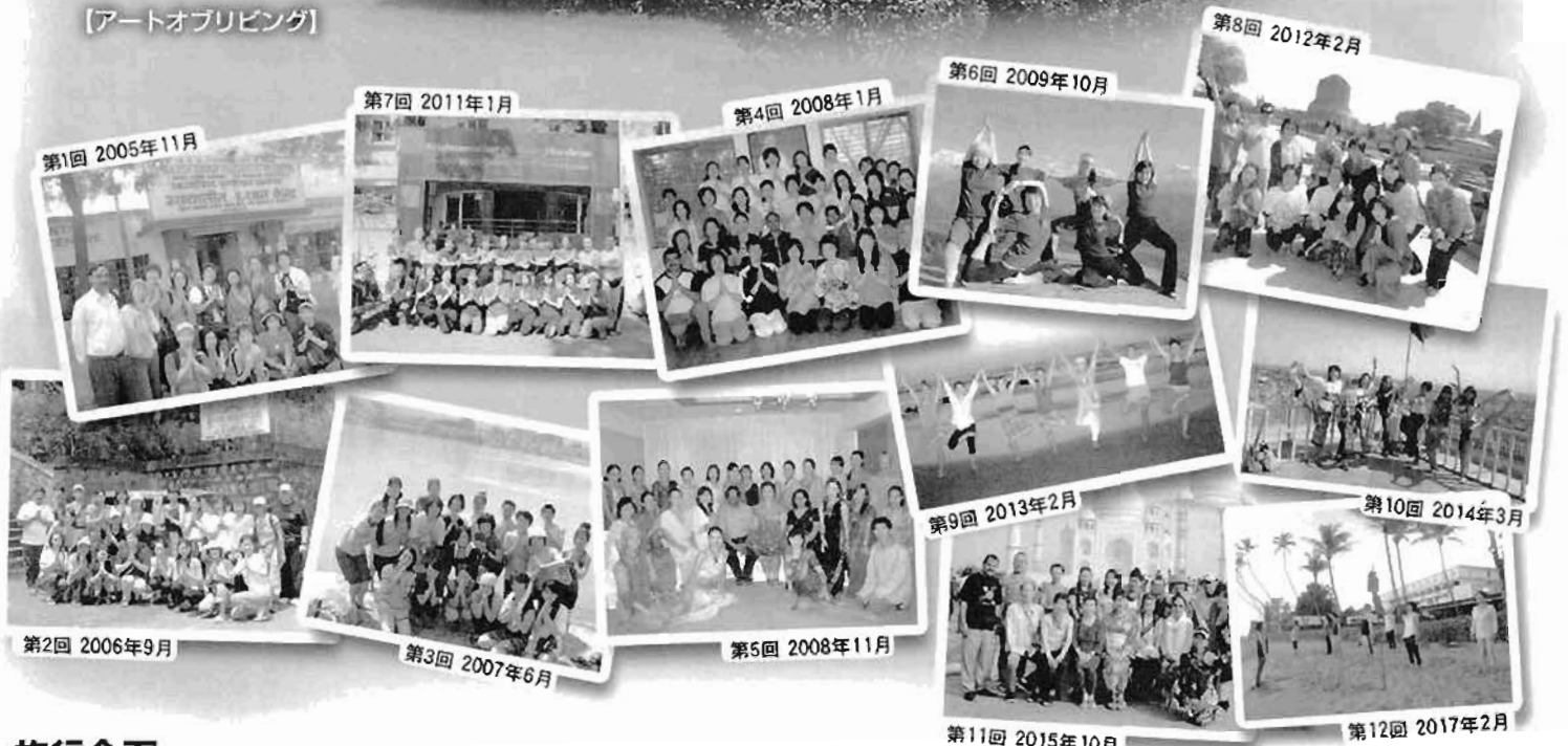
[アートオブリビング]