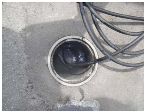
排水桝内部の汚れ状況