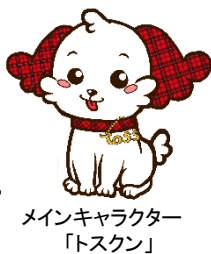
メインキャラクター 「トスクン」

～かしこい子へ最もアプローチ できるのは今この時期～ 「?わからない?」ことは、必ず解決して、 「できる!」にします(無料体験教室2回付き)