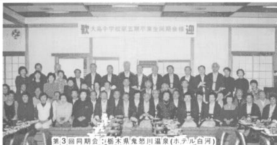
第3回同期会：栃木県鬼怒川温泉(ホテル白河)