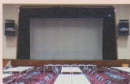
・離島開発総合センター （町民ホールステージ）