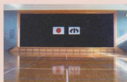
・小値賀町総合体育館 （ステージ）