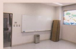
・小値賀町総合体育館 （2階会議室）